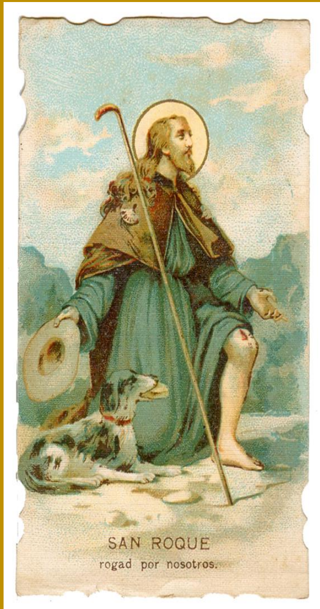
SAN ROQUE rogad por nosotros.

FRATERNIDAD SAN ROQUE DE MONTPELLIER- ROSARIO